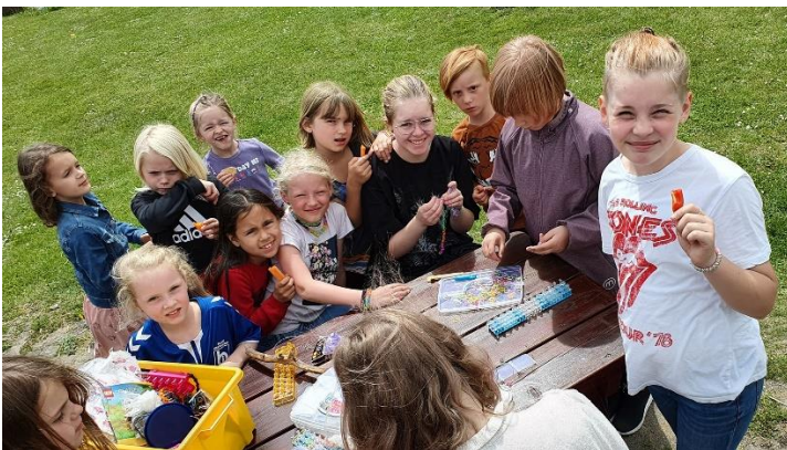
Loom Bands med ude på terrassen.

Vi vil gerne justere os ind på børnene og følge, hvilke aktiviteter de brænder for. Lige nu er det fx loom bands og derfor er de fremme det meste af tiden. Det er dejligt at se, at de fordyber sig og også her udvikler nye ideer.