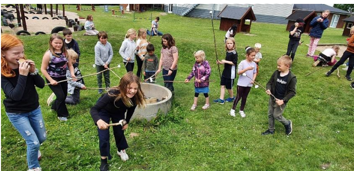
En af de skønne bådage!